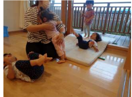
写真1 抱き寄せ 一緒に遊びつつ見守る

今まで私が経験してきた複数の保育者が全体の子どもを見守ることに比べて、担当する子どもを見守っていくことの方が、保育者にとっても子どもにとっても互いの関係性がより深まり愛着関係が結ばれるとともに、保育者は、個々の成長を丁寧に見とることができるのではないかと思う。