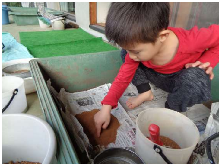
「ちょうこま！」 (こどもたちが名付けた超細かいフルイ)