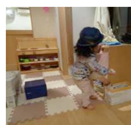
写真8 棚上のティッシュ ティッシュケースから取り出して 鼻をちゅんして 下にあるごみ箱へ

7月の臨時休園中に、A先生が作ったティッシュケースを、8月頃に子どもの手の届く位置に引っ掛けてみた。その頃は、鼻を拭くと言うより引っ張り出して遊ぶモノになってしまい、もったいないことから棚の上に戻すことにした。9月に入って鼻水が出ている子どもが増え、私たちが拭く回数も増えてきた。子ども自身も気になって手の甲でこする事も増えてきたのを見て、もう一度子どもの手の届く位置へ置いた。最初は、鼻水が出ていない子どもも引っ張り出して遊んでいたのだが、「遊ばないよ」と注意を促すと同時に、鼻水が出ている子どもを次々に「ちゅんしてごらん」と、ティッシュを使って鼻をかんでいく動作を何回か繰り返しているうちに、ティッシュの使い方が理解できたのか引っ張り出す遊びが無くなった。また、ティッシュケースが吊るされている反対側にある絵本コーナーには、絵本棚の背面に鏡になるシートが張られており、鼻水が出ている子どもには、保育者と一緒に絵本コーナーのその鏡を見ながら鼻水を拭き、きれいになった気持ちよさを目でも感じられるようにして援助していくと、9月になると保育者の「鼻水かんでごらん」の言葉かけで鼻水を拭き、下においてあるごみ箱に捨てるようになっている。