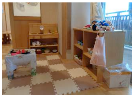
写真2 広いスペースでままごと遊び