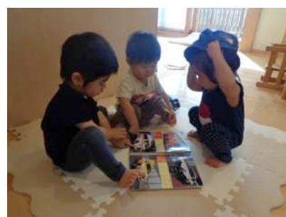
写真7 同チームの子どもが寄り遊ぶ

4月当初は、担当の保育者と子どもの関係だったが、その関係性がしっかり結ばれるとクラスの担任と子ども、園で関わりのある保育者と子どもの関係、子ども同士の関係へと、人間関係が広がっていることが記録から読み取れる。担当制として、しっかりと子どもとの関係性をつないできた関わりの評価が子どもの姿から読み取ることができる。5月頃から、同チームの友だちが登園し顔が見え、歩いて近寄って行く姿も見られ、それが徐々に手を振ったり、ハグをしたりと親密性が増していく様子が見られるようになった。クラスのどの子どもとも一緒に関わって遊んでもいるが、朝夕に入口に送迎に行ったり自然に集まったりスキンシップを取り合ったりするなど、同チームの子ども同士の繋がりは、家族のようにより深く感じられる。そして、何よりも担当保育者との愛着関係は特にしっかりと築かれたと分かる。例えば、担当保育者の私に、抱っこして欲しいなどの甘えたい思いを存分に発揮したり、夕方の送迎時に少し寂しく感じたらぎゅっとハグをしに来たり、抱っこしてほしい気持ちをしっかりと伝えてくる。ひとり一人の心情的なありのままの姿が表出され、その子どもの内なる心をしっかりと私たち担当保育者は受け止めてくれる、心を満たしてくれる拠り所みたいな存在になっているのだと感じる。私たち保育者もその子どもの気持ちをしっかりと汲み取り、丁寧に受け止めている。