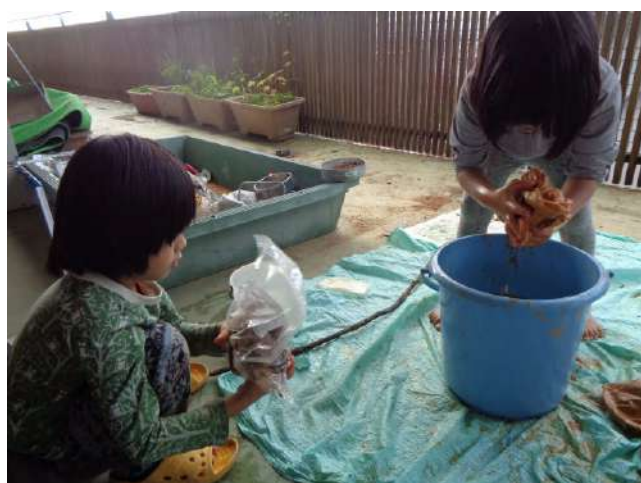
土の染液につける