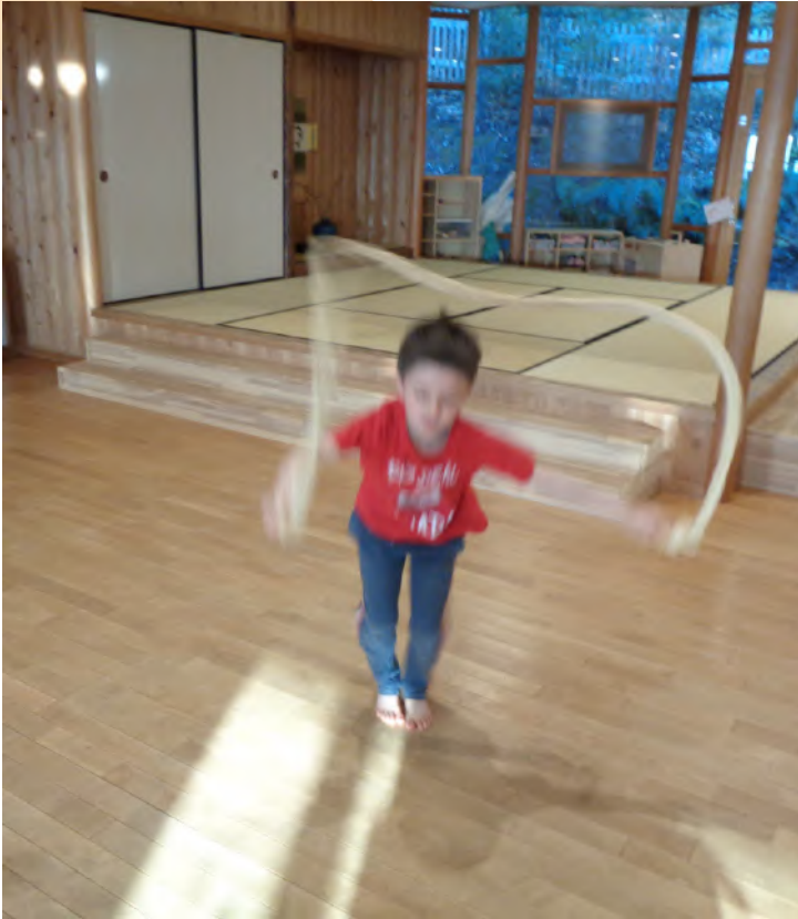
「山の土で染めてん！」