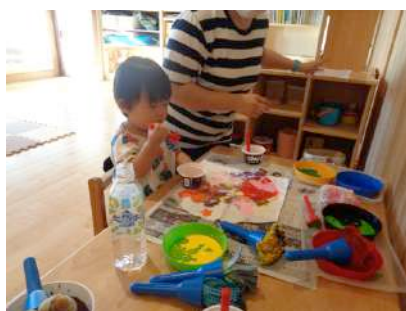
写真3 ままごと遊びから机上遊びの場所