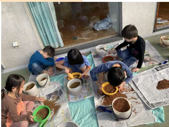
採集した土を砕く