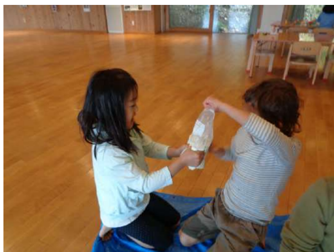
下地作り「モミモミ」